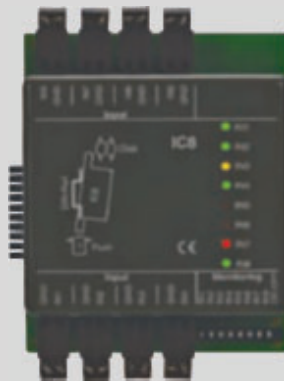
dormakaba Erweiterungsmodul 90 31